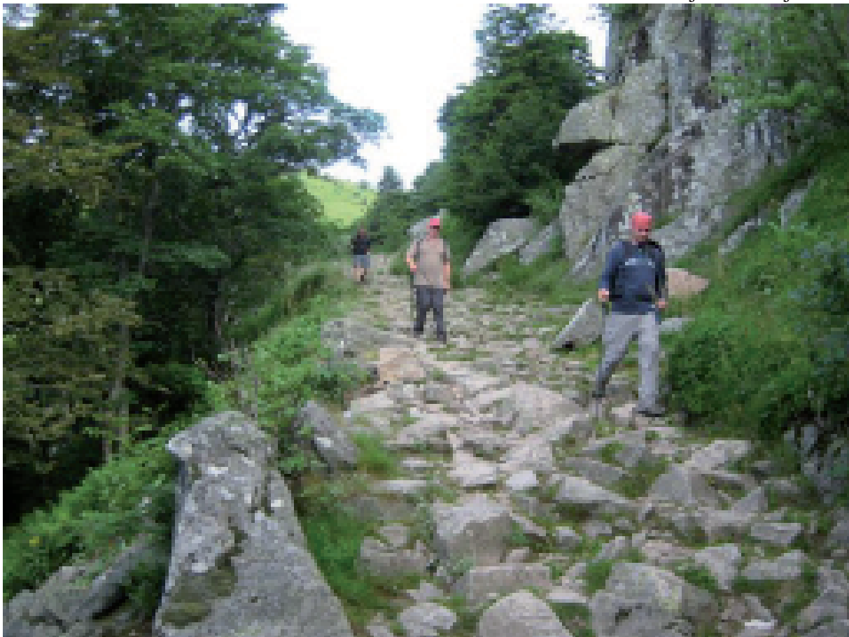
5. Luc piraat wijst de weg over het grote stenen pad.