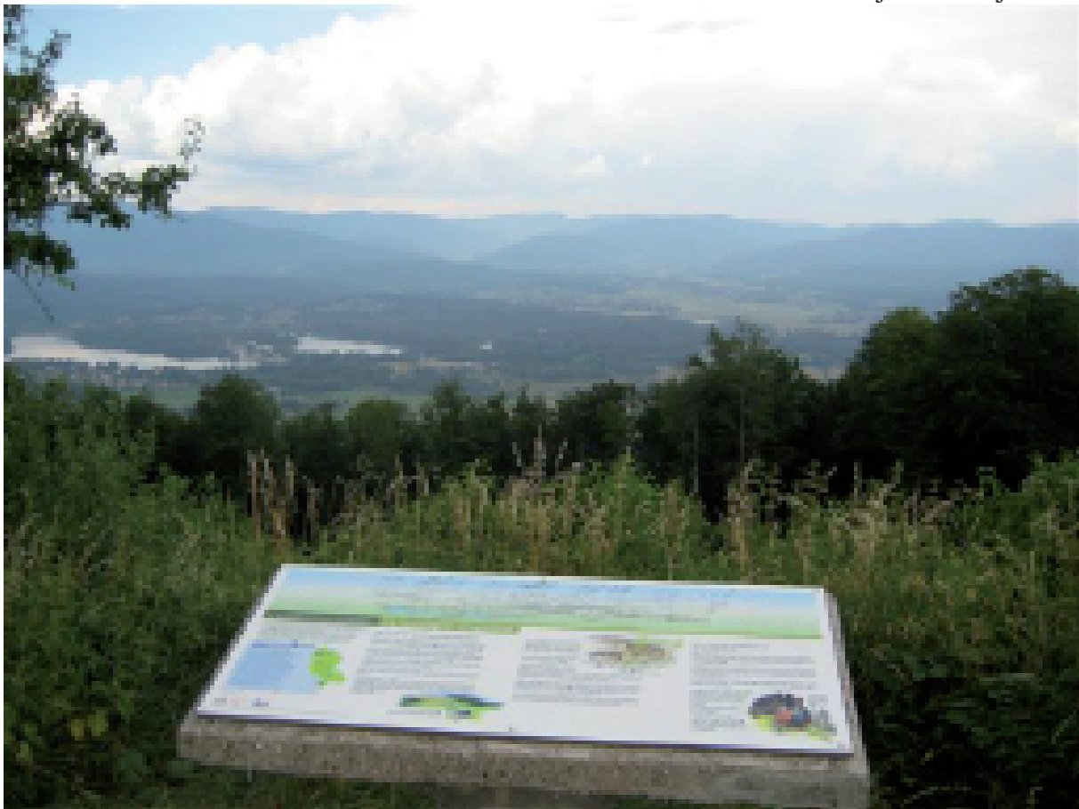
17. Boven op het fort du Salbert. Onze laatste blik op de Vogezen. (= het verleden)