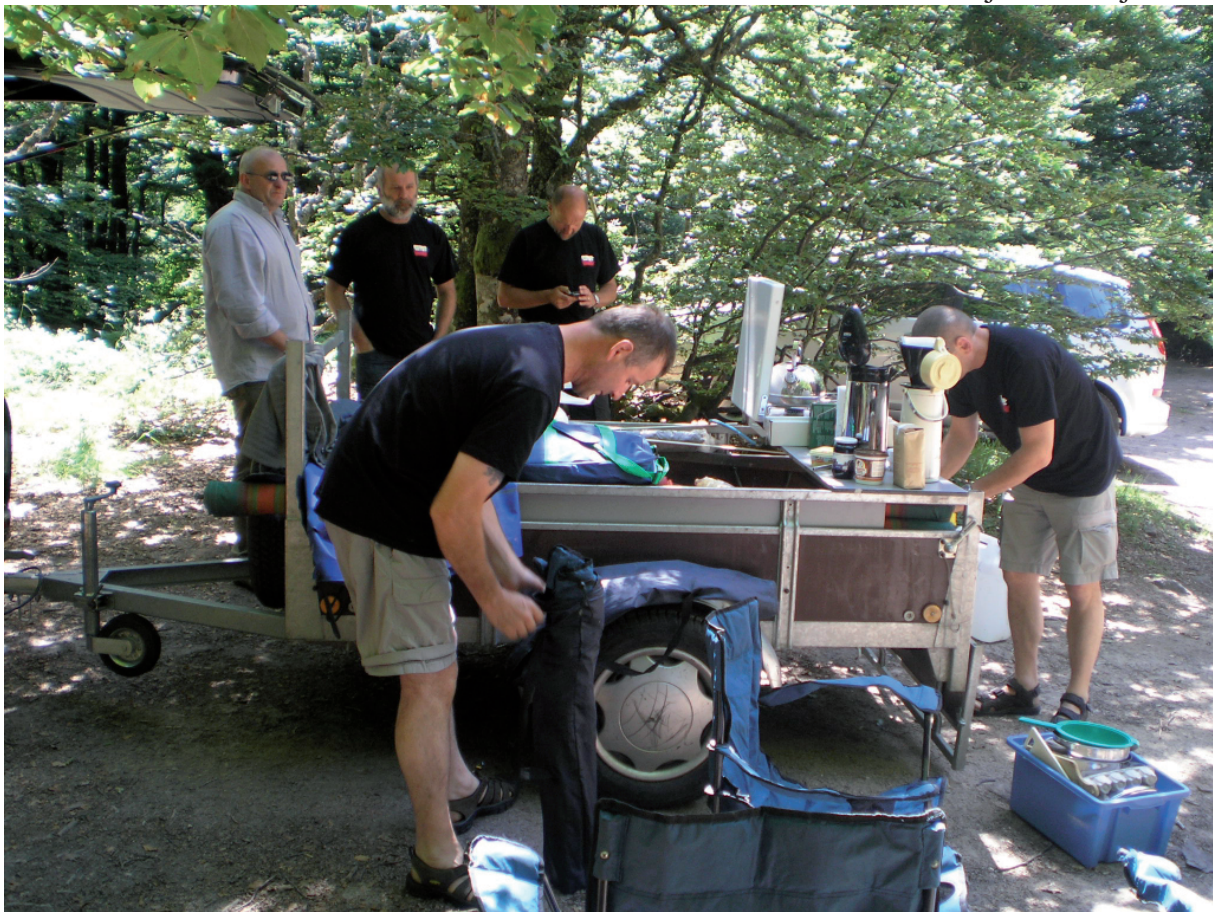
1. Ons vertrek voor deze 8ste jaargang : Drei-eck. Toen STOND (!) de koffie (nog) klaar.