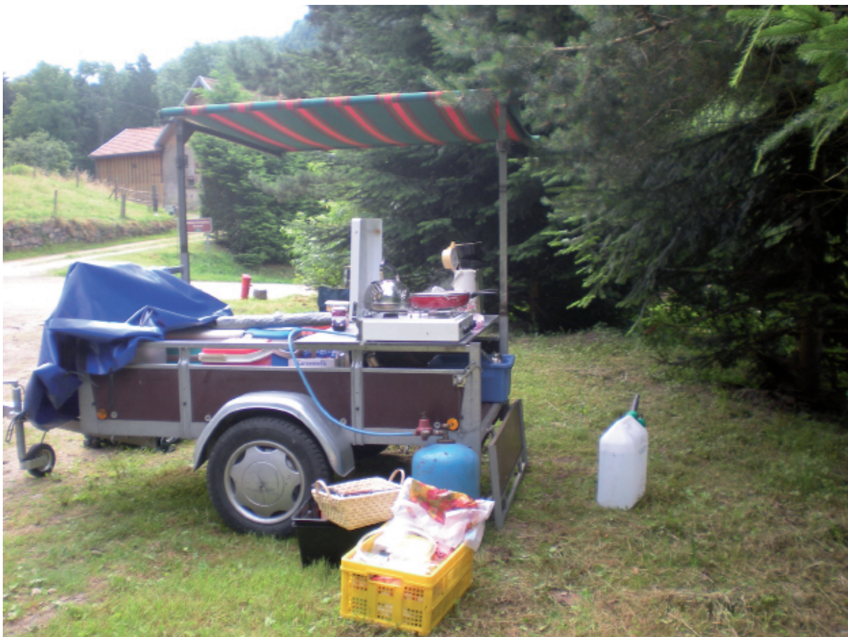
4. Onze veld-infra-structuur: "Ieder jaar beter met Peter"