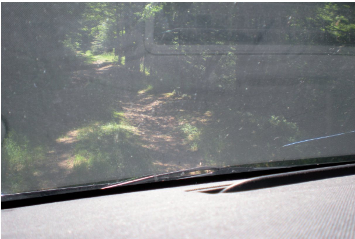
10. Waar men ook gaat op Franse paden of wegen, overal komt men Peter tegen. (Of 't moet zijn dat hij er écht, maar dan ook écht niet door kan).