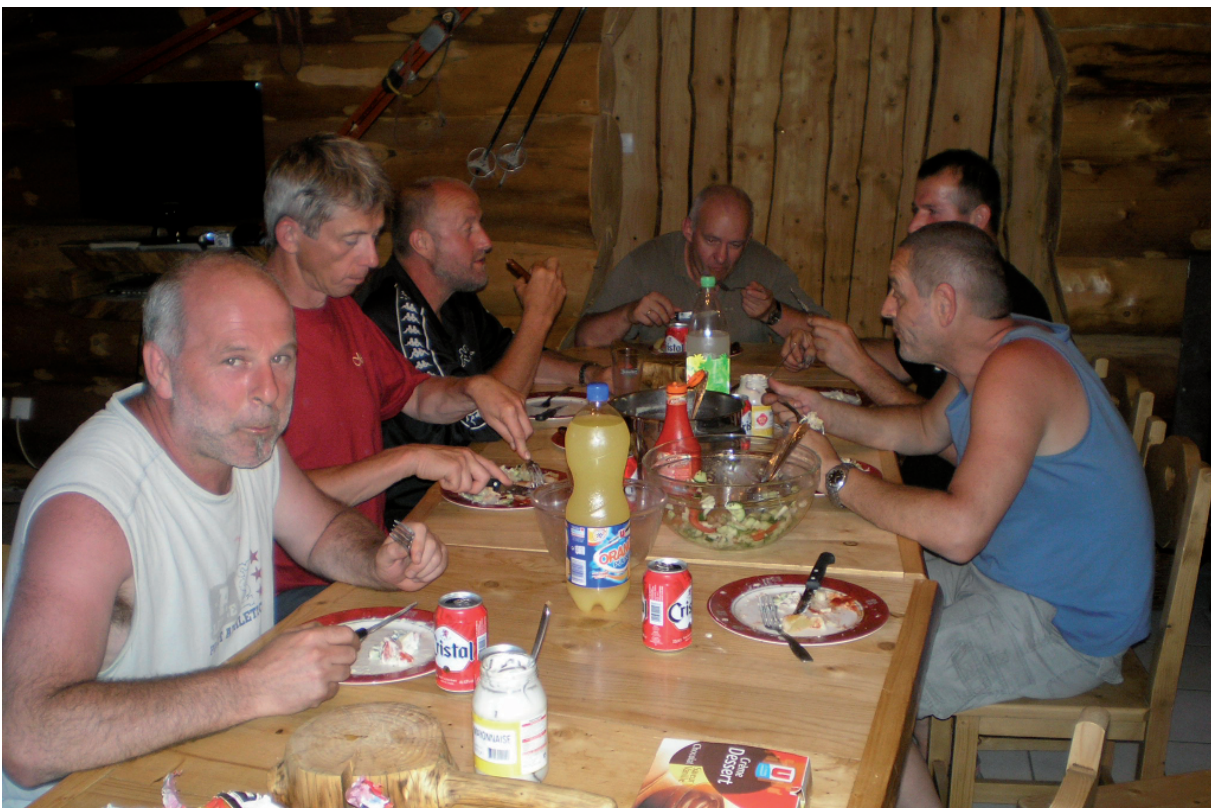
12. Hier dus ook !!!