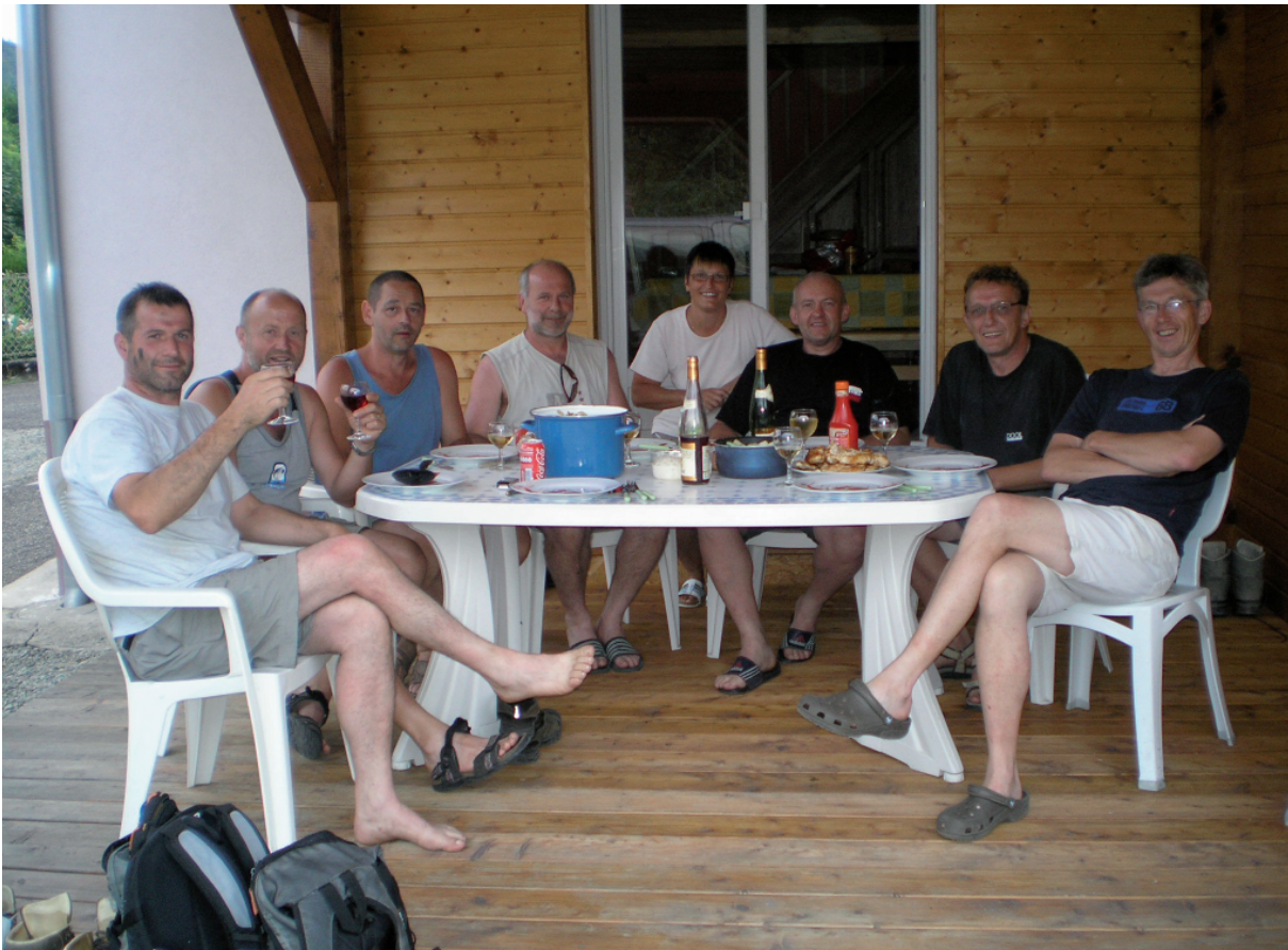
20. Ons laatste avondmaal in Dolleren. (met links op de foto 'BLACK beauty').