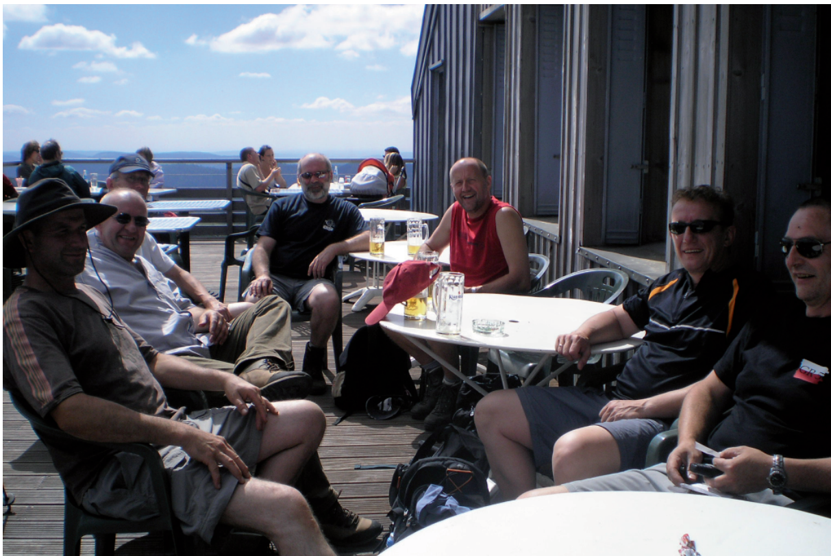
2. Boven op de Hohneck : eindpunt voor dag(je) één. Lekker.....ech lekker..... enne de lamp was nog niet uit !!!