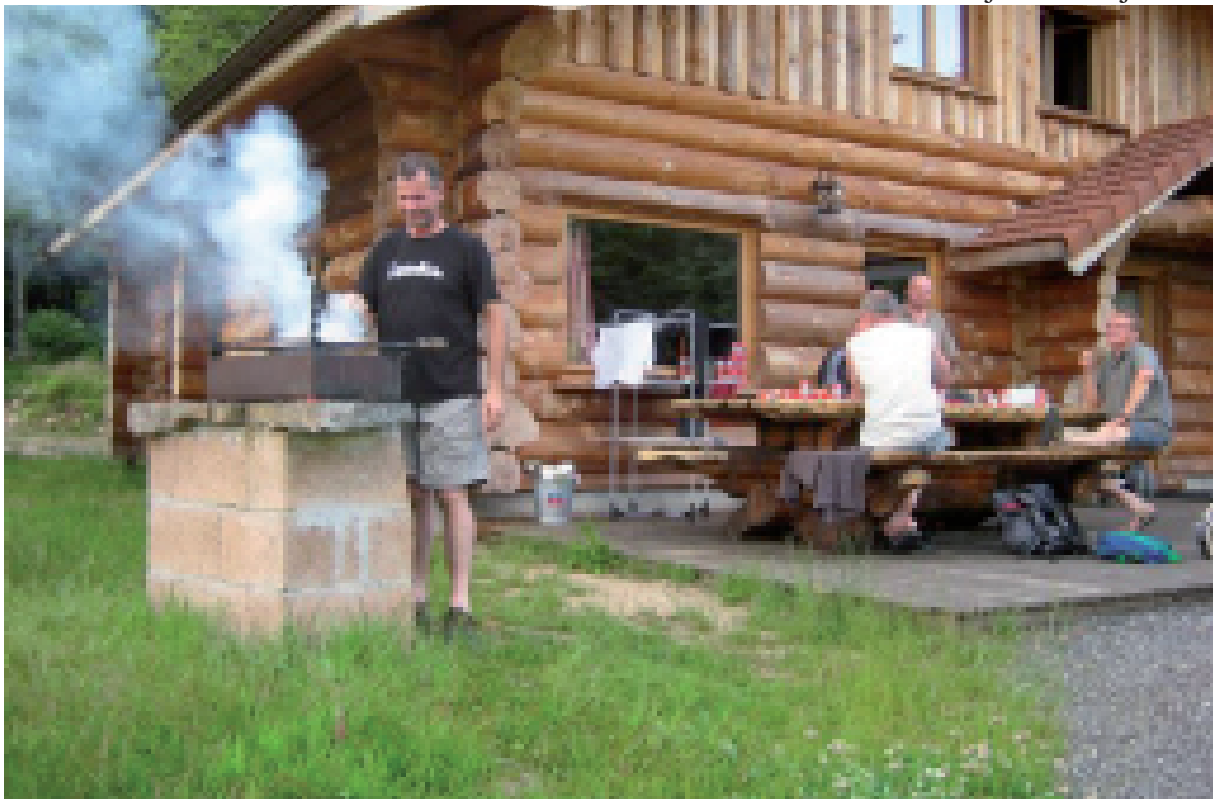
3. Ons mooi verblijf 'Le Couarôge' in La Bresse. Ze worden weer 'bruin' (of zie ik daar "iets" rood) gebakken?