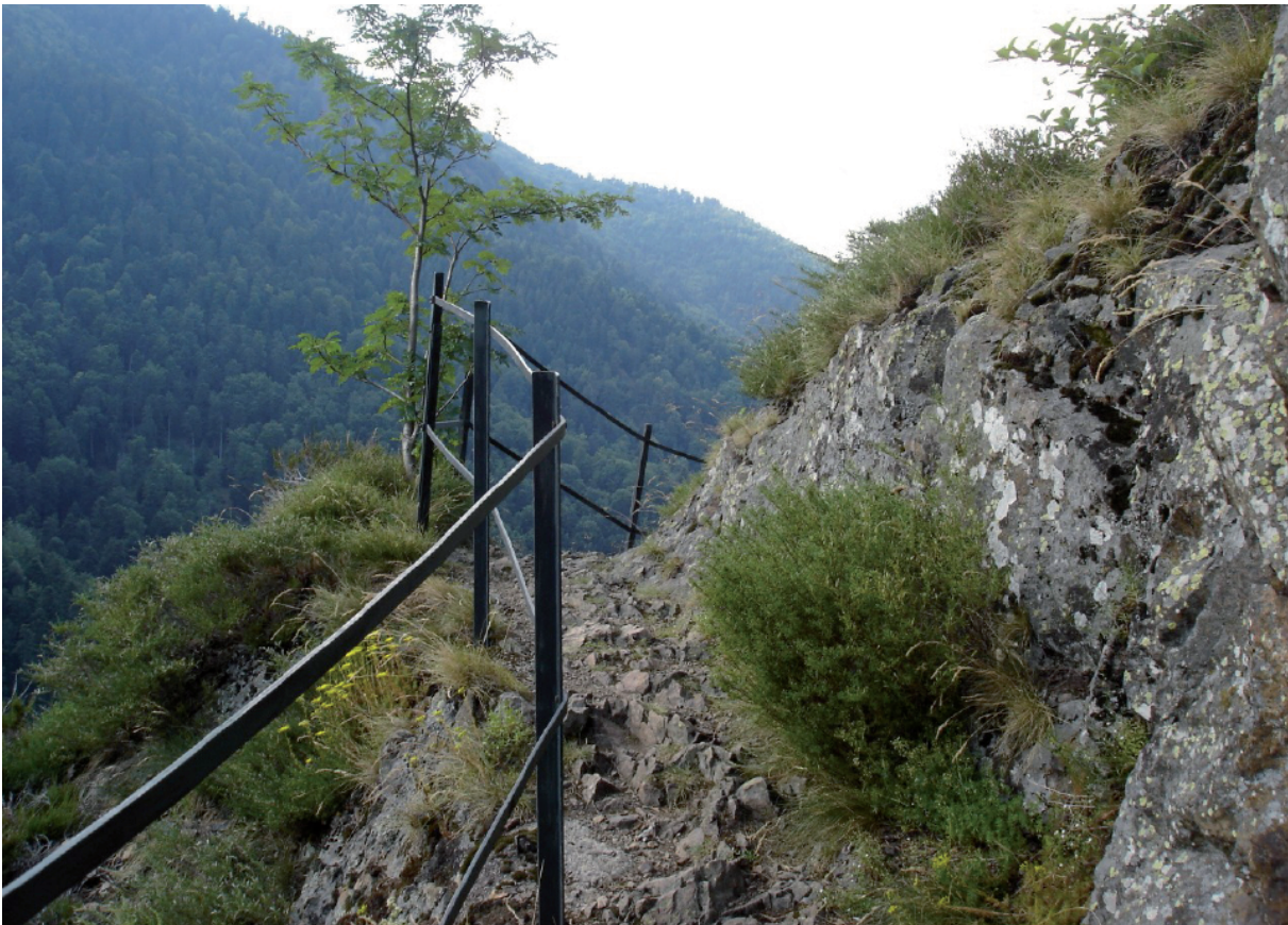
14. GR.....GREAT ROUTE.....GRANDE RANDONNEE..... Inderdaad.....great.....grande.....