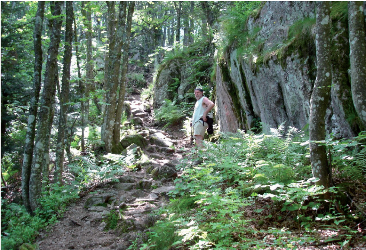
16. Miel in een rotsachtig bosdecor. 'In hogere sferen'