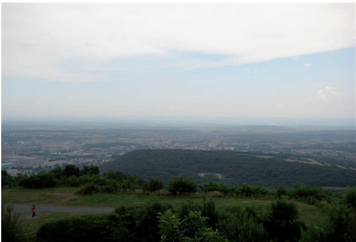
18. En dit wordt 2009, gezien vanop datzelfde fort du Salbert. De Jura+ De Franche-Comté wordt de toekomst.