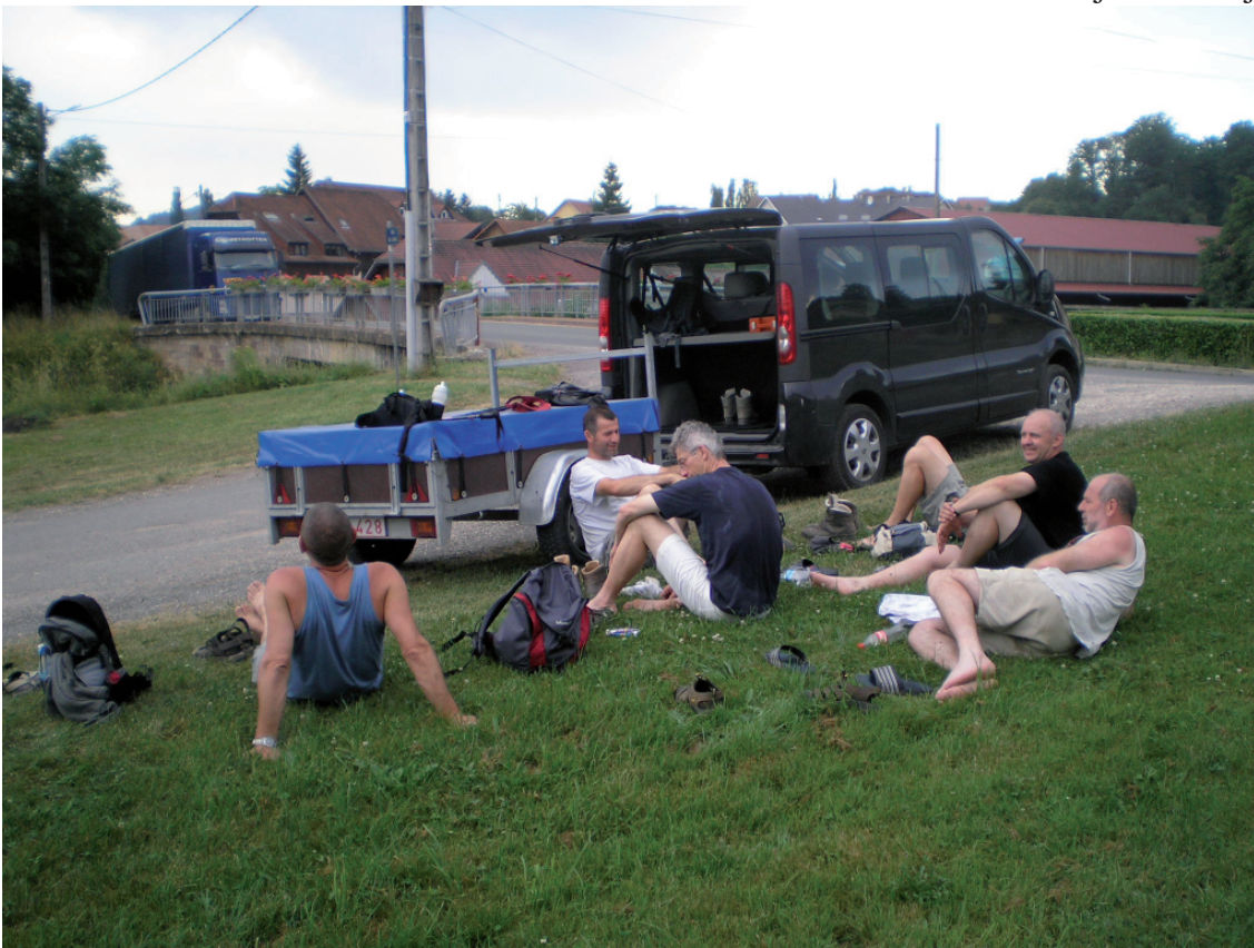
19. Hier zwierven we onze schoenen aan de haak of..... Ons eindpunt voor 2008 en ....aan de paal met het verstopte papier vertrekt editie