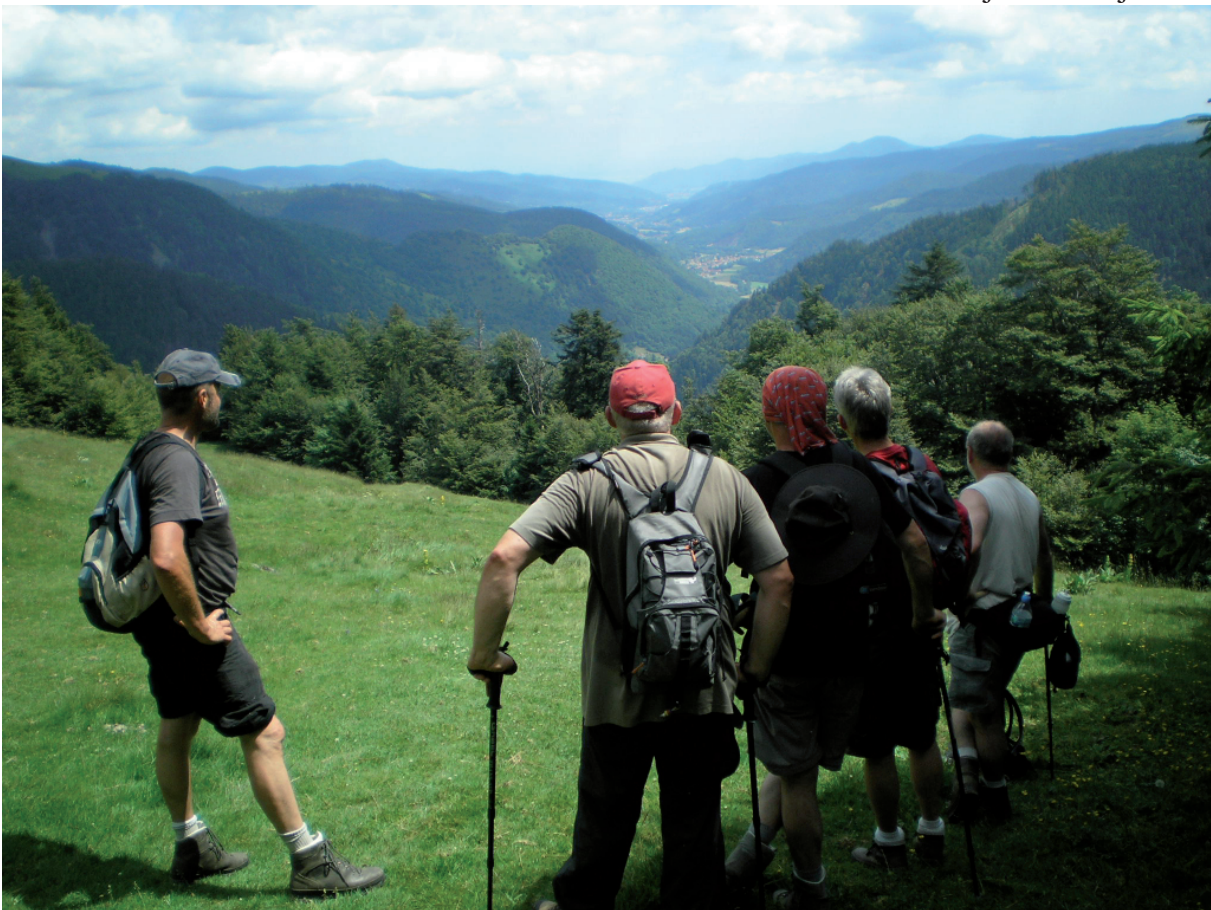
11. Een en al bewondering !!! De neuzen (zelfs van de fotograaf) wijzen allemaal in dezelfde richting.