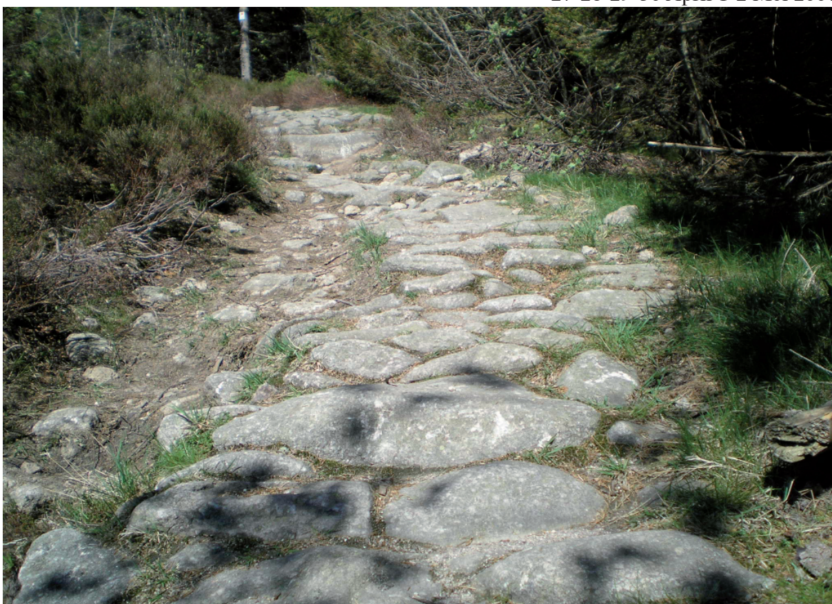
13. Hier( en dat kilometers-ver) hebben er te veel gedacht dat ze de 1ste steenlegging moesten doen.