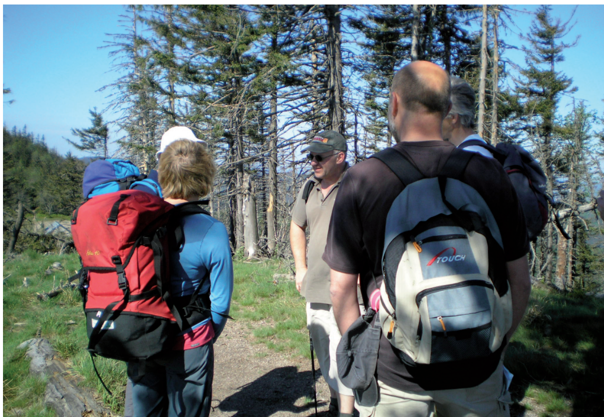
16. En (heel soms) komen we wel eens echte “soortgenoten” tegen met hetzelfde GR-5-gevoel.