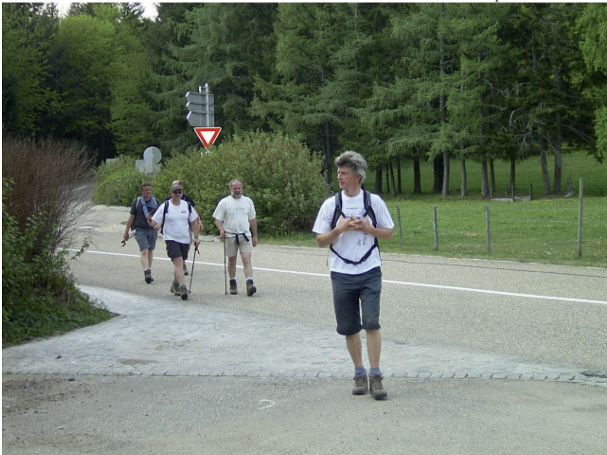
5. Volg de gids wordt niet altijd zo letterlijk genomen.....