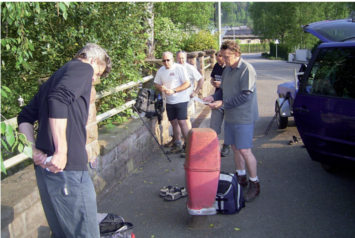
2. Hey, die brandkraan van vorig jaar is nog niet verplaatst, precies. Ready to go !!!