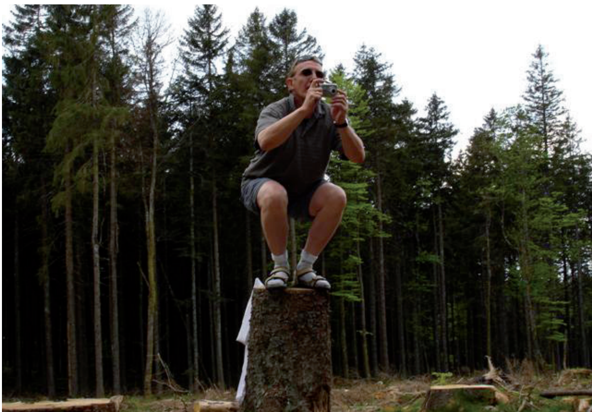
6. Allicht wordt dit een foto met 'kikvors-perspectief'