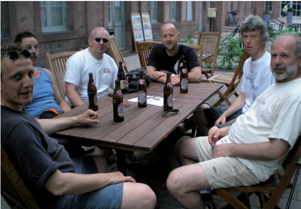
8. Op Mont Sainte Odile past enkel een godendrank.