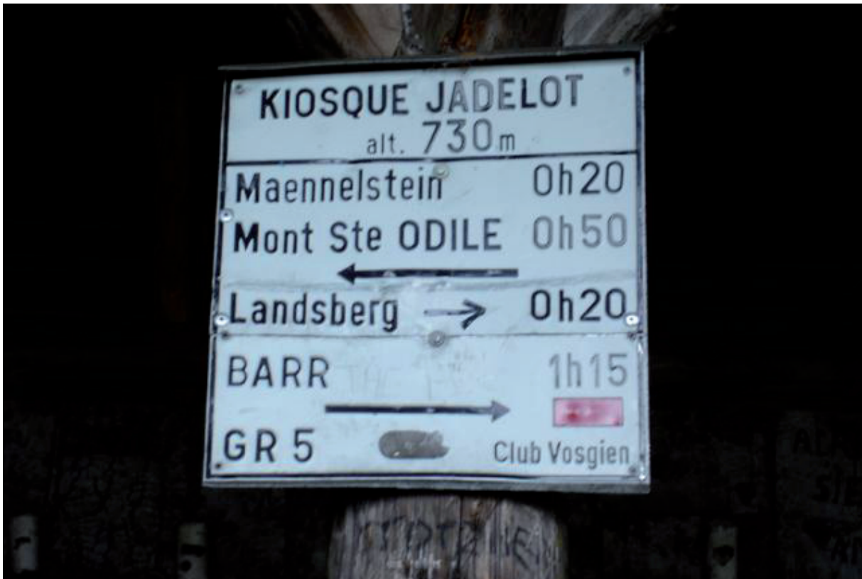
10. Net vertrokken bij Odile. Vergeet de deur niet dicht te doen. Anders trekt het te zeer op het pad.