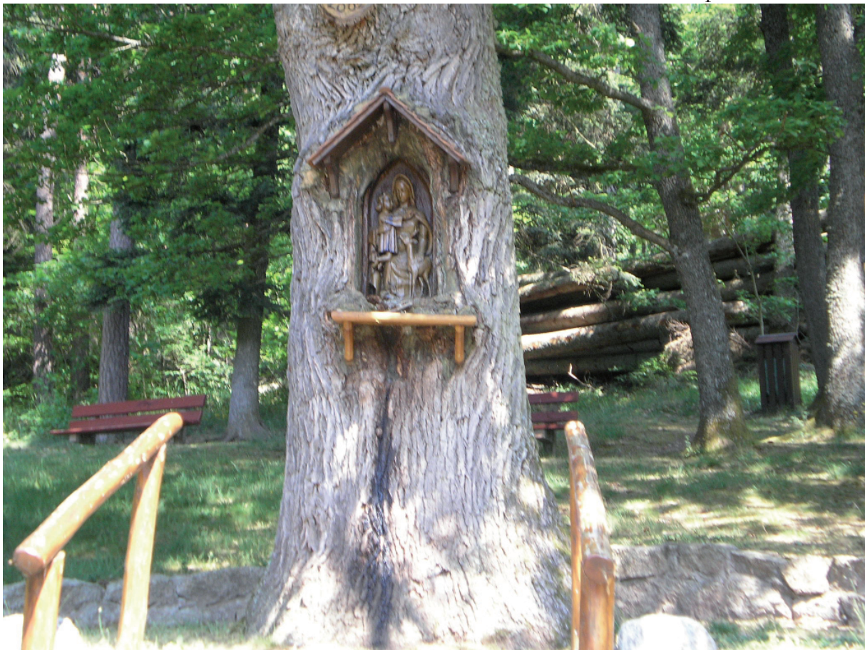
11. Wij zegden het al bij onze 1ste jaargang : Pelgrims onderweg.