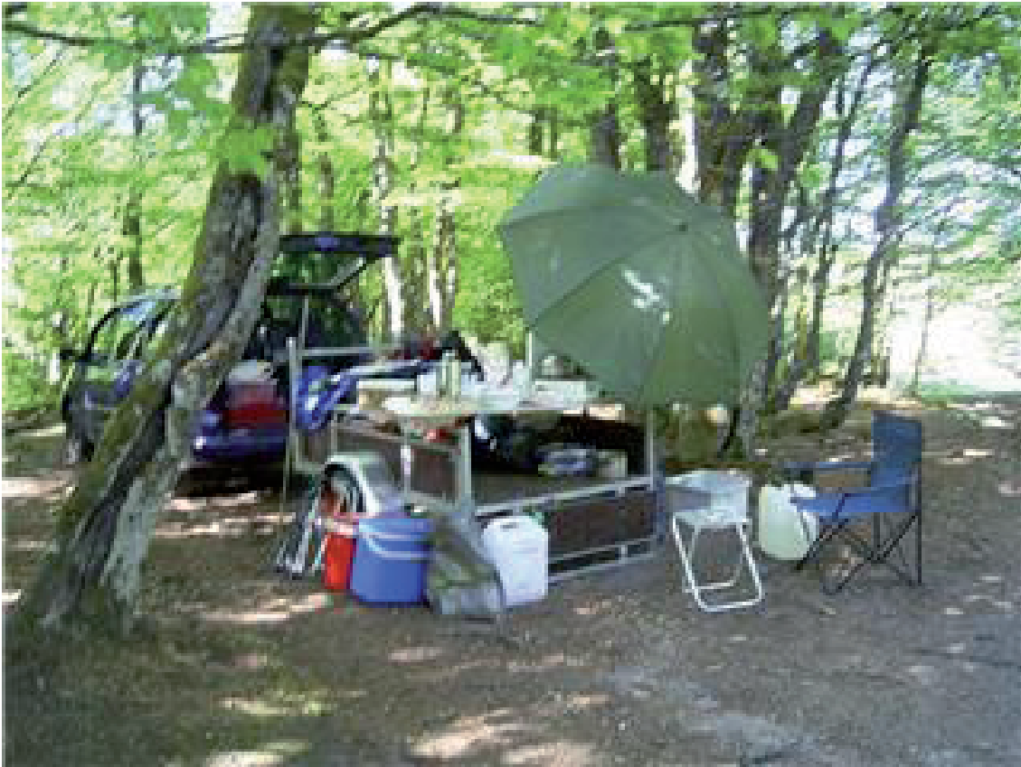
19. Laatste maal- eetmaal in Drei-eck. Terminus voor 2007.