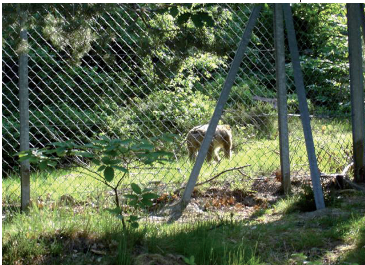
15. In Wick (op La Montagne des singes) vergezelden enkele “soortgenoten” ons op ons pad.