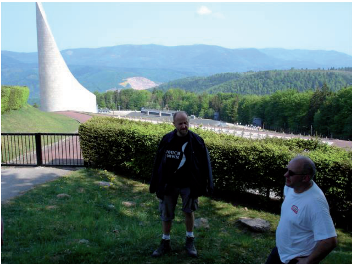
4. Bij het zien van deze massa graven bij Struthof : “Effe (a touch) down”.