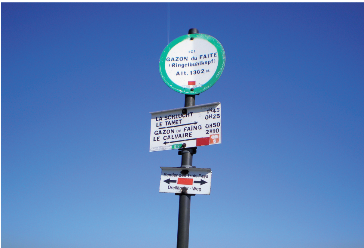
18. Ons (letterlijk) hoogtepunt van dit jaar : Gazon du Faite (1302 m)