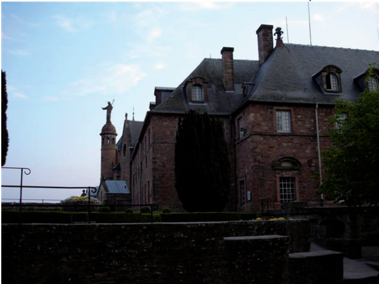
9. En Sainte Odile zag dat het goed was. (behalve dat 'ring-ding' bij het avondmaal.)