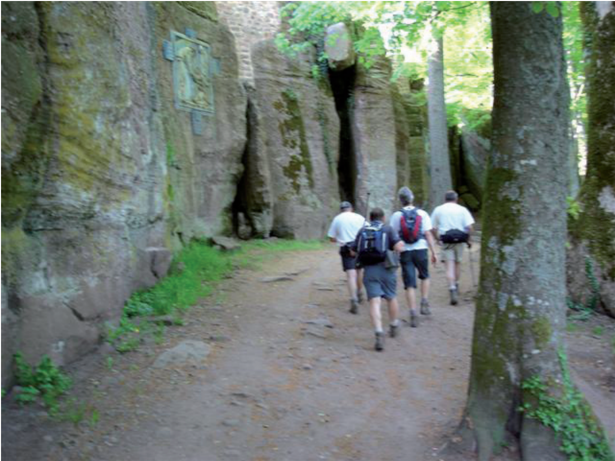
7. De kruisweg tot Mont Sainte Odile : voor ons zeker geen Calvarieberg