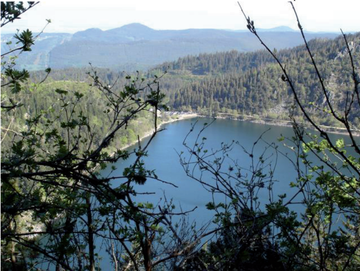
17. Wandelen rond Les Lacs. Mooi, maar soms een STEEN-zwaar parcours.