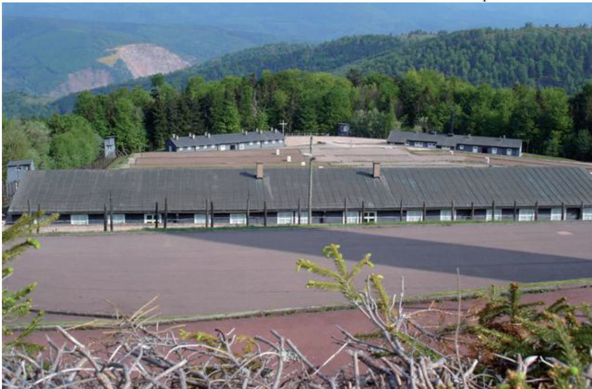
3. Concentratiekamp Struthof. Om adembenemd stil van te worden !!!