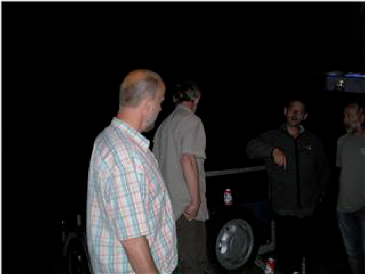
1. Op de vooravond van onze 7de jaargang. Om lol te hebben (liefst) geen 5-sterren-accommodatie.