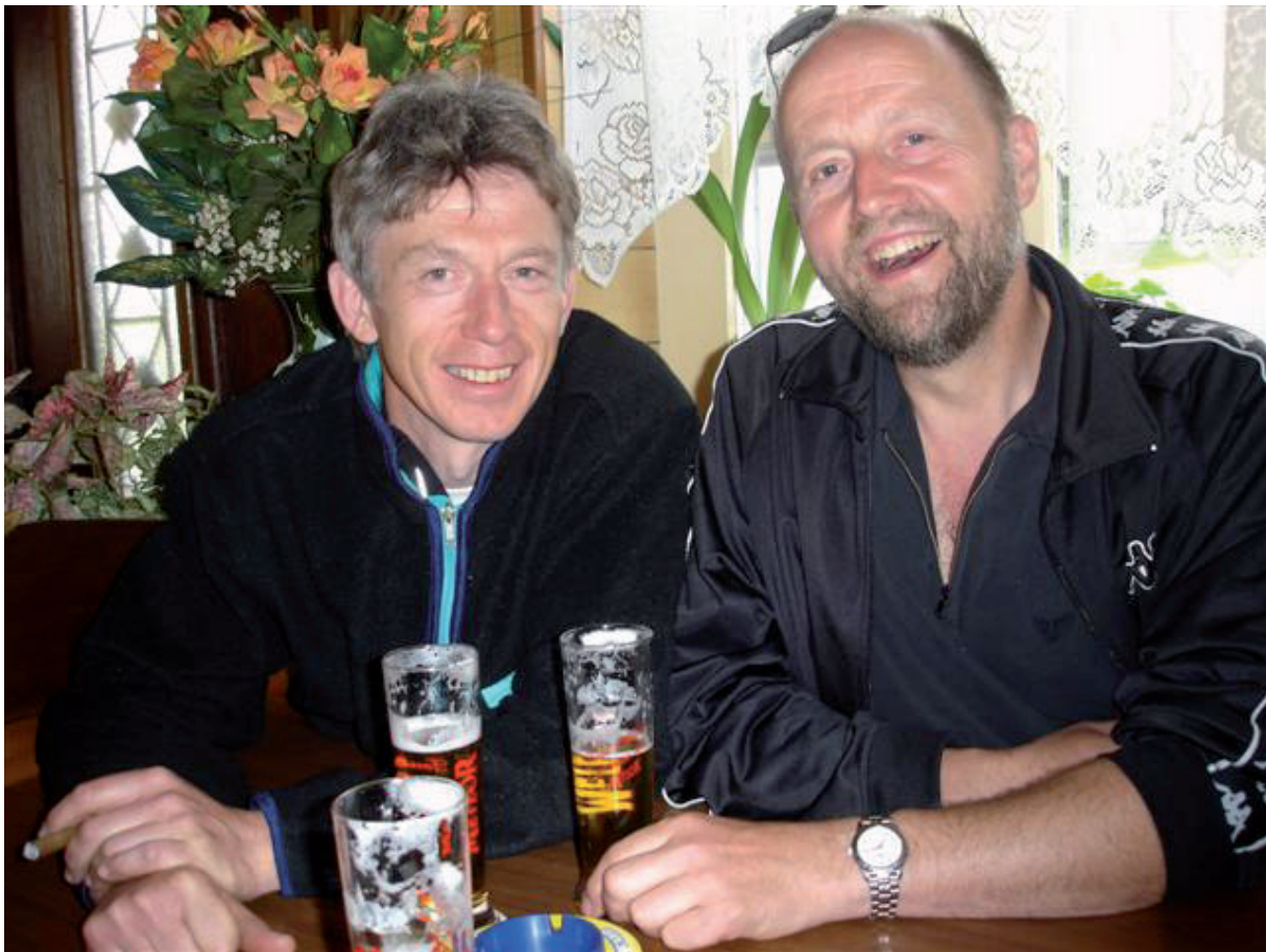
5. Daar in dat kleine café aan de haven.....