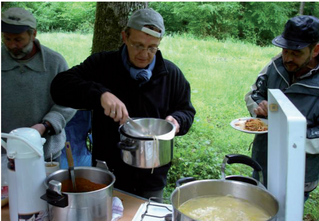
6. Steeds goed-gemutst !!!