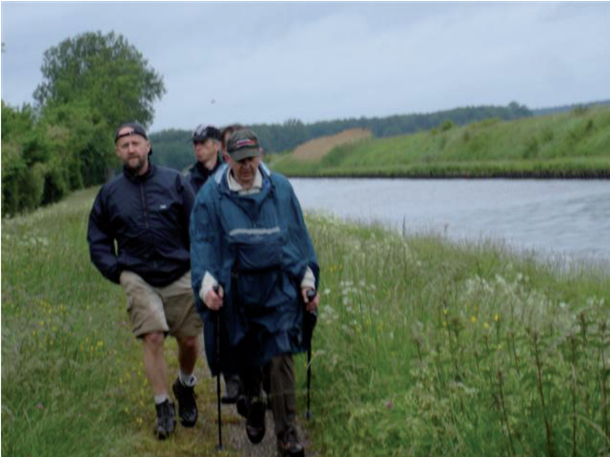
9. Hier was het gras 2 kontjes hoog en 6 kontjes nat.