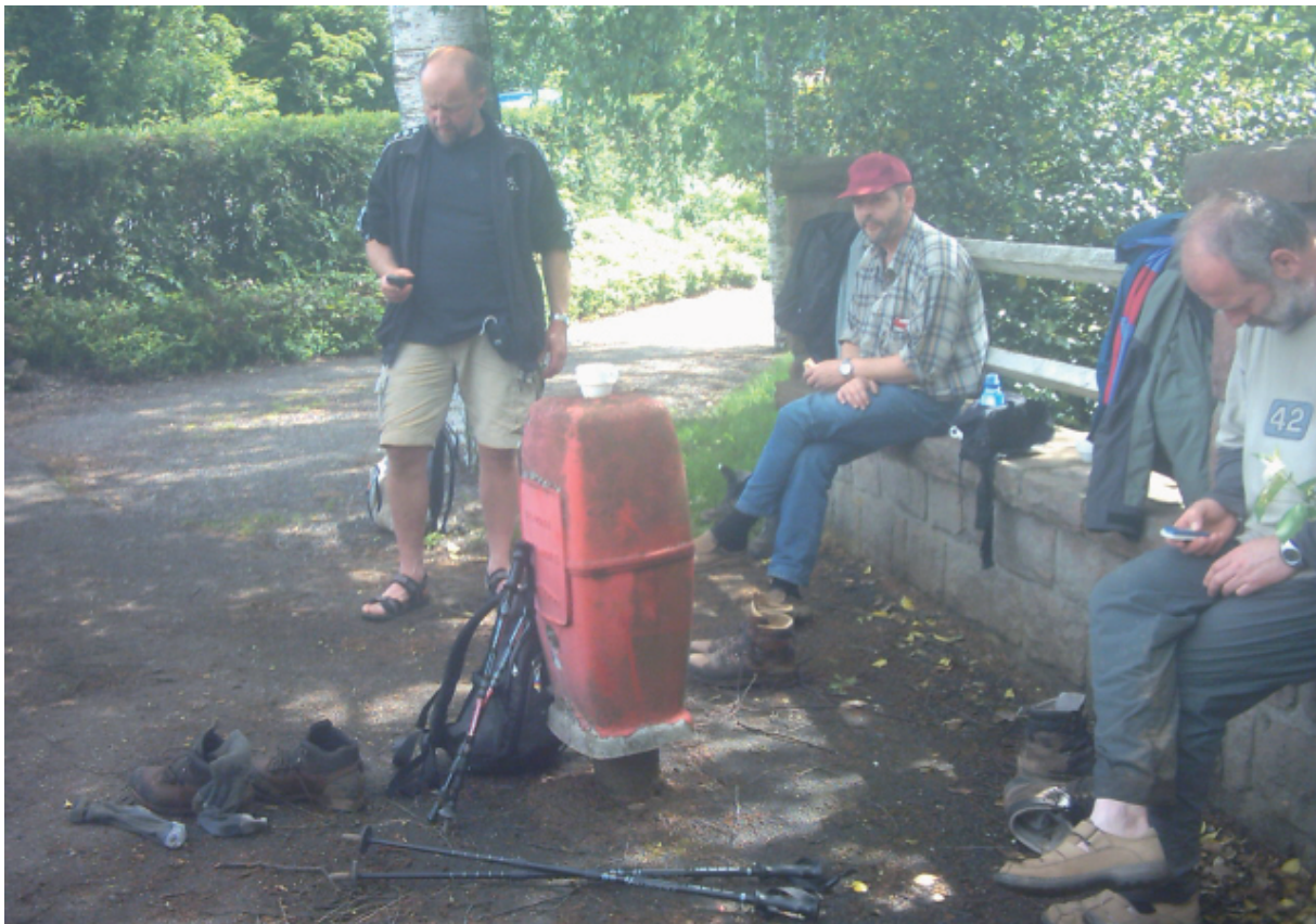
19. Aangekomen aan de brandkraan!!!! Het SMS-berichtje allicht ook in Helchteren.