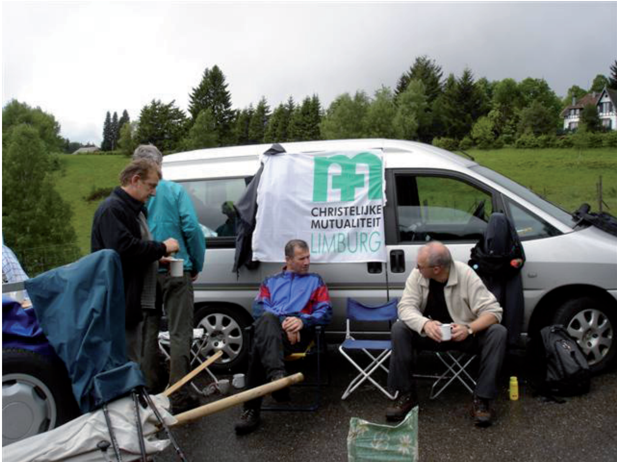
17. Na den DoNON. Let's 'talk'(Zwitsal?) voor ons laatste turbo-speed-stuk.