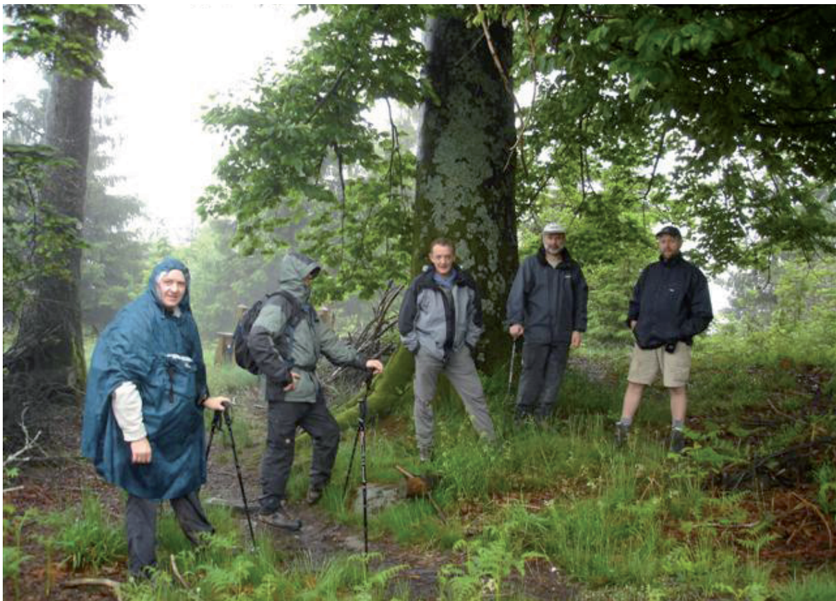
14. "Ende buim steit op de berrich....."