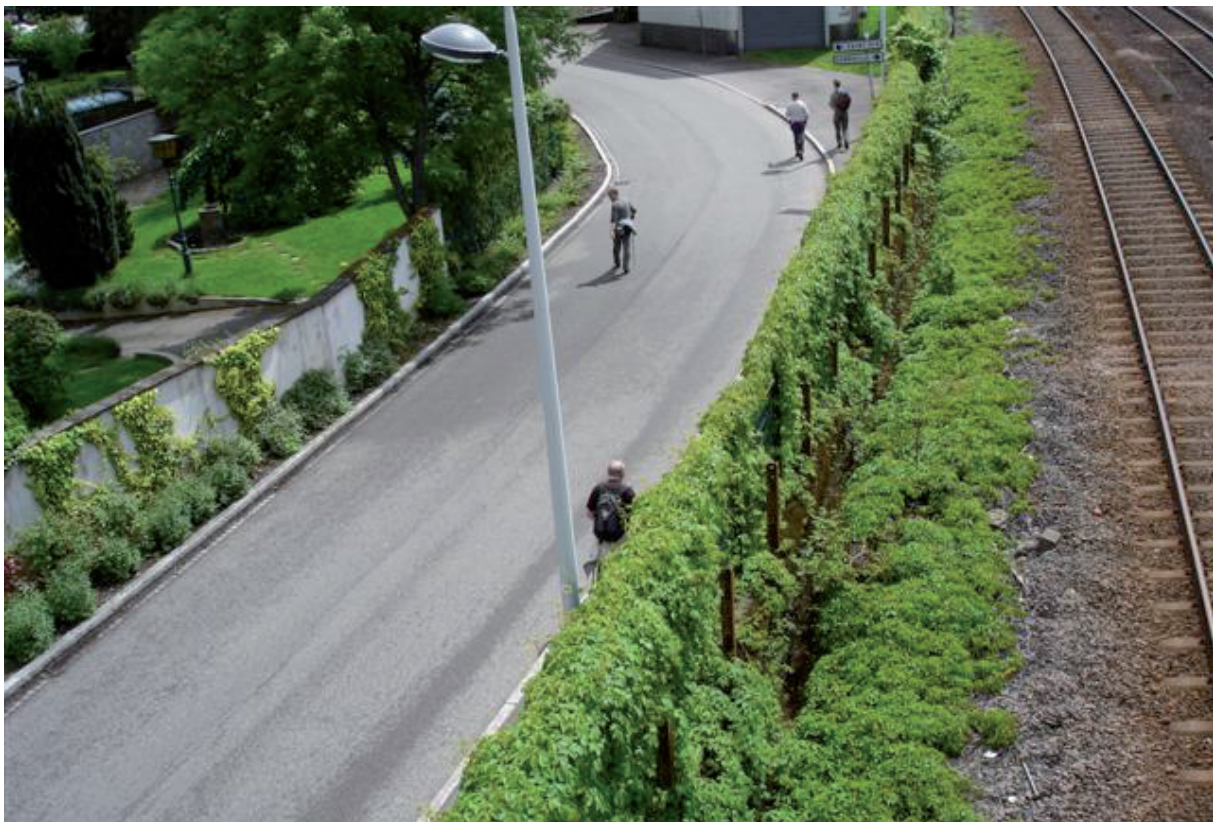
18. Onze laatste meters uit deze jaargang. Wij het spoor kwijt? NOOIT !