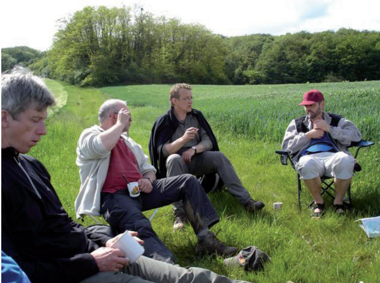
4. Ondanks het feit dat het giet nog ver van onze gîte.