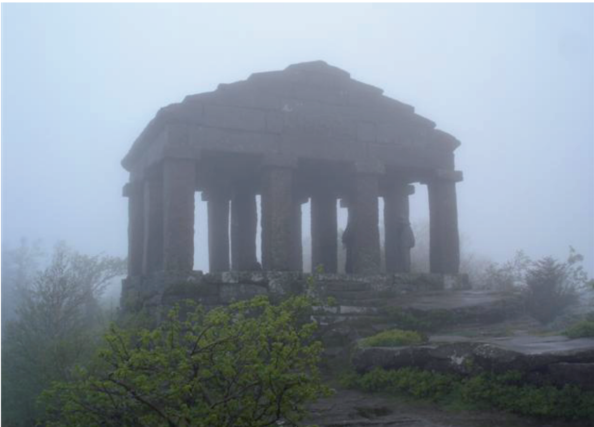
16. Bovenop de Donon (1008 m). De tempel heeft die dag iets extra-‘mist’erieus.