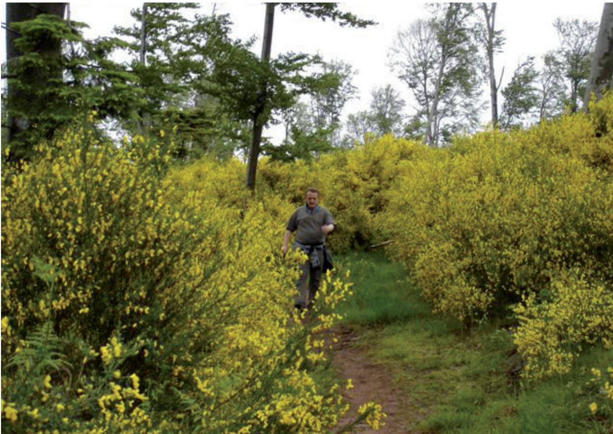
10. En dit pad staat niet in de gele, maar wel in de topogids.