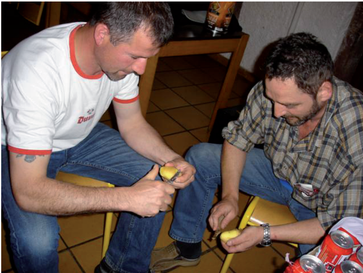
11. Patatten jassen- best per 2- want 10 kilo = nog altijd 2 X 5 kilo !!!