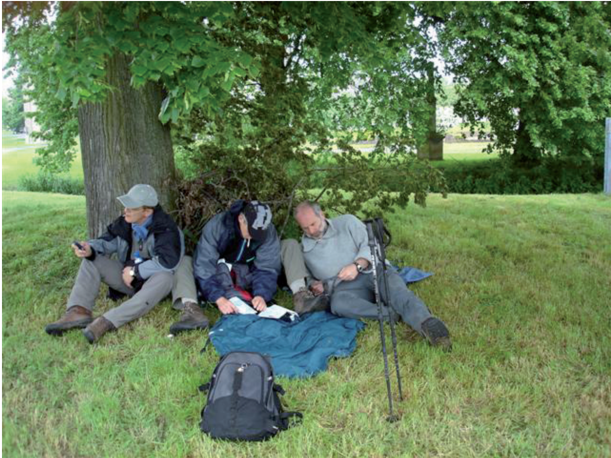
7. Under the big t(h)ree.