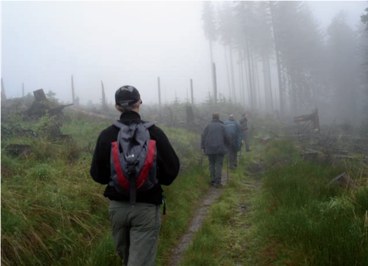
15. De wind doet (soms hoor en zichtbaar) verrassend goed zijn (achter)werk.