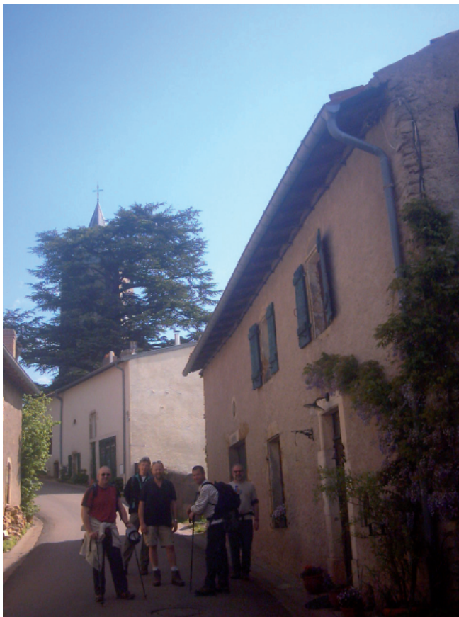
2. En dit is echt anno 2006. Daar doen we het dus (ook) voor. Eenvoudig = soms het mooist !!!